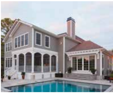
REVÊTEMENT DE COMPOSITE CELLULAIRE CELECT MD