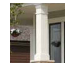
Enveloppes de colonne