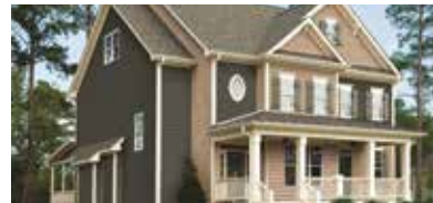
VOLETS, PRISES ET ÉVENTS MD