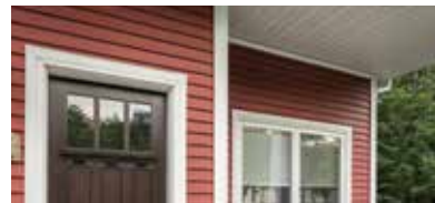
REVÊTEMENT DE VINYLE ROYAL MD