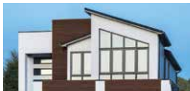
REVÊTEMENT D'ALUMINIUM CEDAR RENDITIONS MC