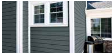
MOULURES EXTÉRIEURES ROYAL MD