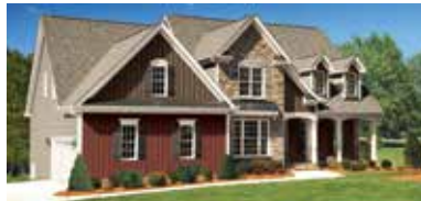
REVÊTEMENT ISOLANT HAVEN MD