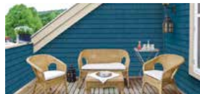
REVÊTEMENT BARDEAUX PORTSMOUTH MC